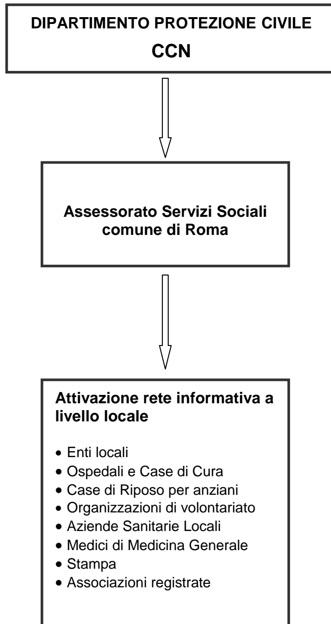
Figura 1. Schema di flusso della rete informativa per la prevenzione degli effetti del caldo sulla salute per il Comune di Roma